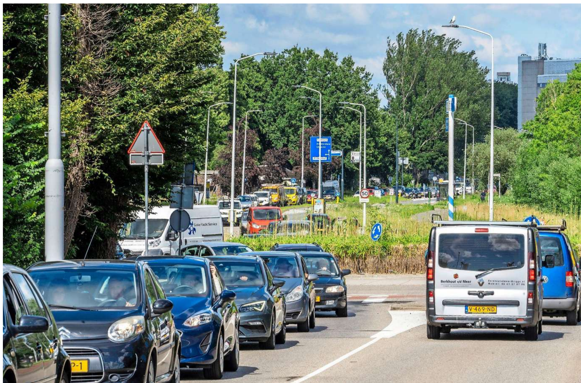
Stilstaand verkeer op de Haagse Schouwweg, van Plesmanlaan tot aan de Stevenshof.