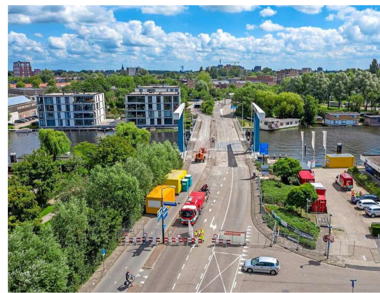
De Churchillbrug is twee maanden dicht voor renovatie.