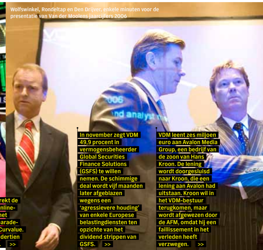
Wolfswinkel, Rondeltap en Den Drijver, enkele minuten voor de presentatie van Van der Moolens jaarcijfers 2006

In november zegt VDM 49,9 procent in vermogensbeheerder Global Securities Finance Solutions (GSFS) te willen nemen. De schimmige deal wordt vijf maanden later afgeblazen wegens een 'agressievere houding' van enkele Europese belastingdiensten ten opzichte van het dividend strippen van GSFS. >>