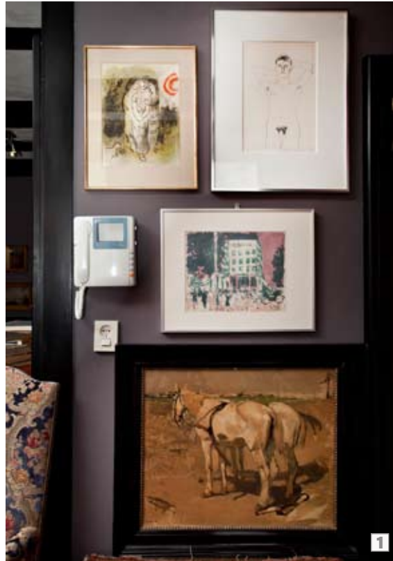
> 1 Hockney, Chagall, Breitner, Bonnard, Siemens > 2 De bibliotheek met een glimpje boekenkast, het negentiende-eeuwse Italiaanse bureau, en een detonerende Artemide-lamp

EMOTIE 'Het aardige van wat ouder worden is dat je jezelf kunt omgeven met spullen die een bepaalde emotionele waarde hebben. Je weet hoe dat gaat, je komt wat tegen en als je het mooi vindt, neem je het mee. De voorwerpen die me het dierbaarst zijn, zie je daarachter op het tafeltje. Het zijn oliegietschoteltjes die ik heb opgegraven bij Massada. Toen ik nog studeerde, heb ik me aangemeld als hulpje bij archeologische opgravingen in Jeruzalem en op de berg. We vonden er een stuk of tweeduizend, twee staan er nu hier. In dit soort spullen draag je je leven met je mee.'