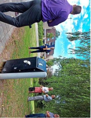
Onder een reusachtige boom staat een auto met een dak van de Voorhoftaan. Wethouder Willem Joosten met bewoners.

Het is een bijzonder decor: onder een reusachtige boom staat een auto met een dak van de Voorhoftaan en de Galassian spreker de wethouder met de burgemeester. Het is een bijzonder decor: onder een reusachtige boom staat een auto met een dak van de Voorhoftaan en de Galassian spreker de wethouder met de burgemeester.